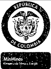
TABLA DE RETENCIÓN DOCUMENTAL