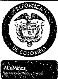
TABLA DE RETENCIÓN DOCUMENTAL