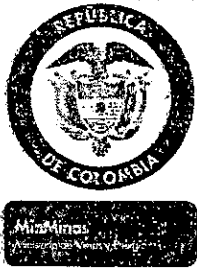
TABLA DE RETENCIÓN DOCUMENTAL