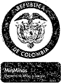
TABLA DE RETENCIÓN DOCUMENTAL