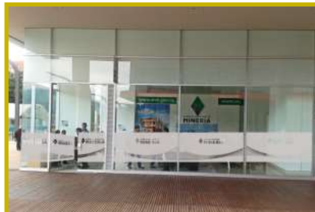
Nuevo punto de atención en Bogotá