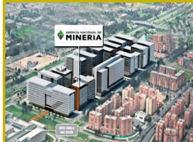
Sede central - Bogotá